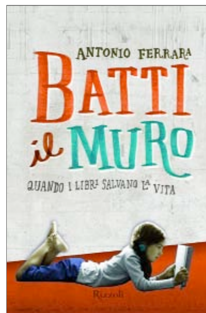
Antonio Ferrara, Batti il muro , Milano, Rizzoli, 2011, pp. 180, euro 10,90